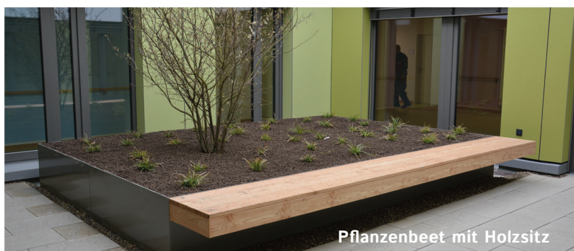
Pflanzenbeet mit Holzstz

Ihnen Qualität zu, auf der Basis der geltenden technischen Regeln und Normen. Die SME ist zertifizierter Schweißfachbetrieb und WHG-Fachbetrieb. Mit ausgebildeten Mitarbeitern und einem umfassenden Maschinenpark haben wir die Kraft Ihre Zufriedenheit zu bedienen und Sie zu überzeugen.