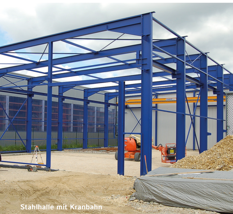
Stahlhalle mit Kranbahn