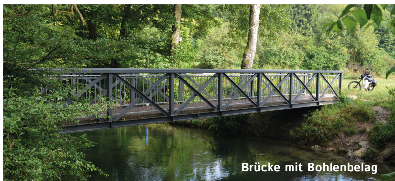
Brücke mit Bohlenbelag